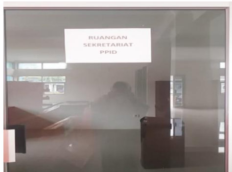
Gambar 1: Ruang Sekretariat PPID Pembantu Dinas Perhubungan Prov. Kaltim.